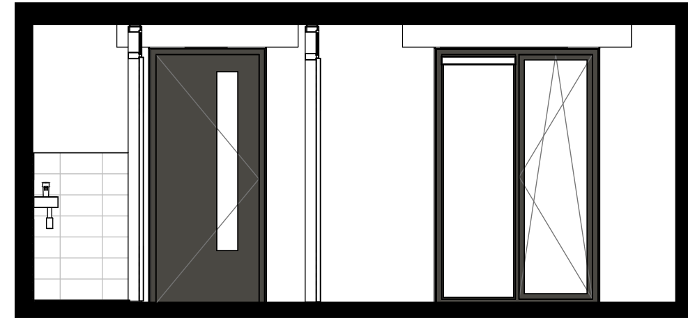
dwarsdoorsnede achter 1:50