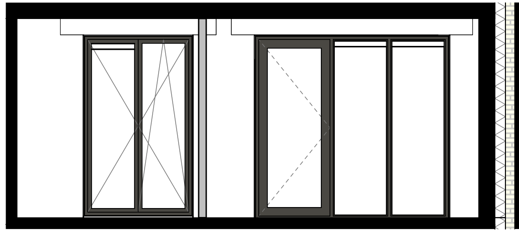
dwarsdoorsnede voor 1:50