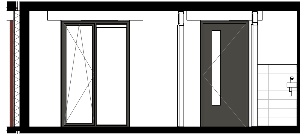
dwarsdoorsnede achter 1:50