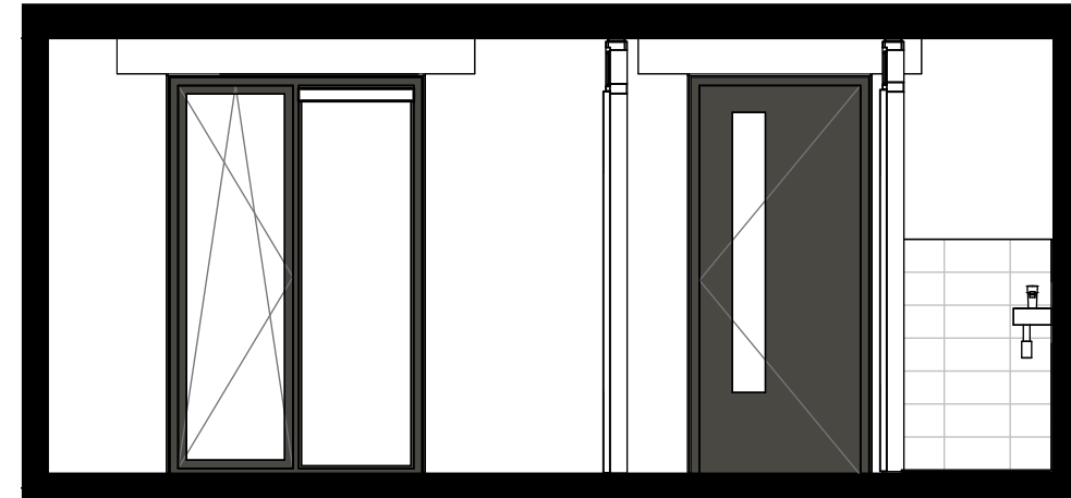
dwarsdoorsnede achter 1:50