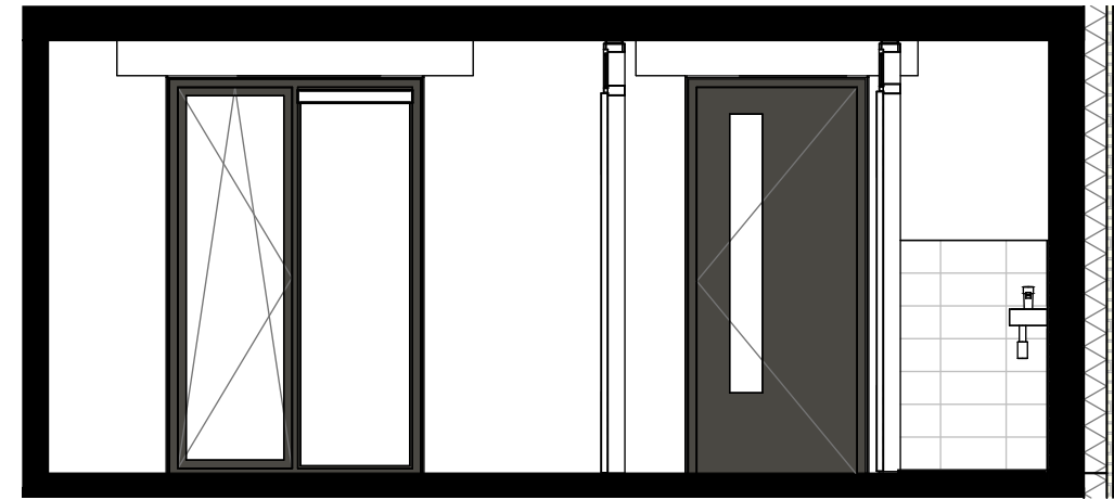
dwarsdoorsnede achter 1:50