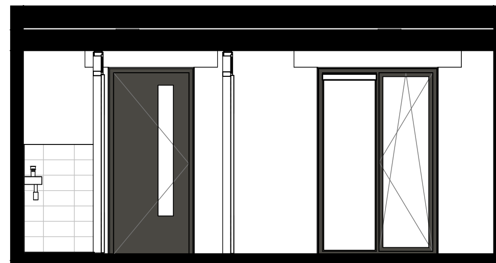
dwarsdoorsnede achter 1:50