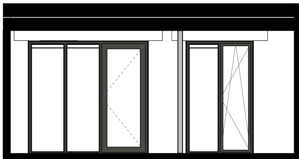
dwarsdoorsnede voor 1:50